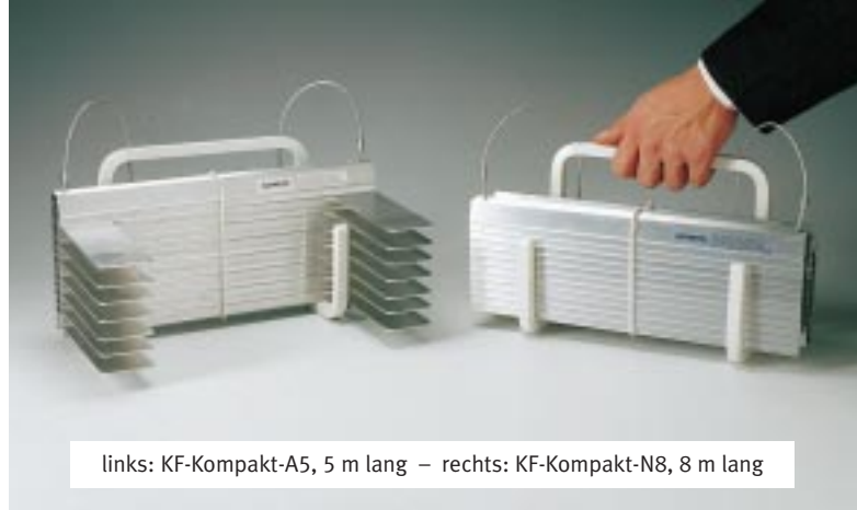
links: KF-Kompakt-A5, 5 m lang – rechts: KF-Kompakt-N8, 8 m lang

»KLETTER-FIX« Die kleinste Rettungsleiter der Welt