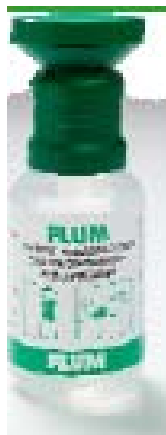
płyn do płukania